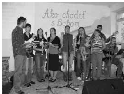
20 regionálne stretnutie mládeže

V jesennom období sa brigády zameriavali na úpravu podkrovia, aby mohla slúžiť na ubytovanie počas konferencie mládeže aj misijnej konferencie. Stavba už má takmer všetky okná, takže vnútri budú práce pokračovať aj počas zimy. Chceli by sme dokončiť tepelné izolácie a ďalej sa venovať inštalácii vody a elektriny. Od cieľa nás delia ešte snáď dva roky Veľa závisí od finančných možností. Tam, kde tie naše končia, Božie sa nevyčerpajú a my pokračujeme vo viere, že On bude s nami ako doteraz.