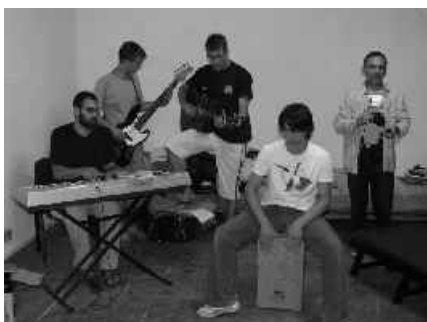
16 po práci nám je do spevu