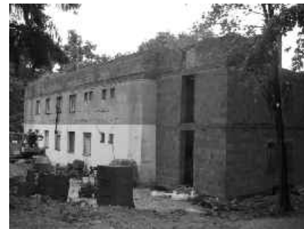
00 tu sme skončili vlni

Lepšie raz vidieť ako stokrát počuť Aktuálne info na www.berea.sk/chata