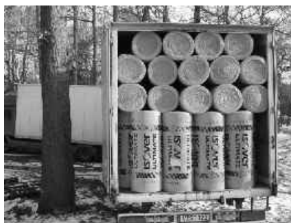
02 z Nemecka prišla „sklená vata“

Rozobratím starej strechy na jar minulého roka sme prekročili Rubikon - odteraz sa už nedá vrátiť späť! Pustili sme sa do práce vo viere, že ju budeme môcť dokončiť, hoci sme nemali dost prostriedkov na vybudovanie novej strechy. Stavebné práce rýchle vyčerpali naše zdroje, preto sme pokračovali len pomaly s malým počtom najatých robotníkov. Pomohli nám dve dodávky izolačnej minerálnej vlny, ktorú sme dostali ako dar od veriacich z Nemecka.