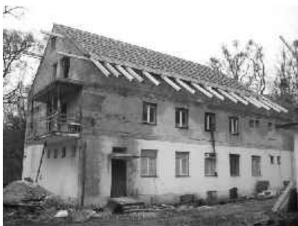
03 prší nám do domu

Rozobratím starej strechy na jar minulého roka sme prekročili Rubikon - odteraz sa už nedá vrátiť späť! Pustili sme sa do práce vo viere, že ju budeme môcť dokončiť, hoci sme nemali dost prostriedkov na vybudovanie novej strechy. Stavebné práce rýchle vyčerpali naše zdroje, preto sme pokračovali len pomaly s malým počtom najatých robotníkov. Pomohli nám dve dodávky izolačnej minerálnej vlny, ktorú sme dostali ako dar od veriacich z Nemecka.