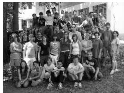
15 mládežnícka brigáda