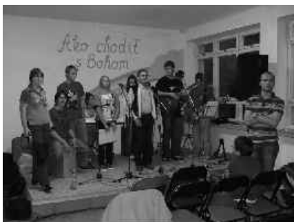
19 regionálne stretnutie mládeže