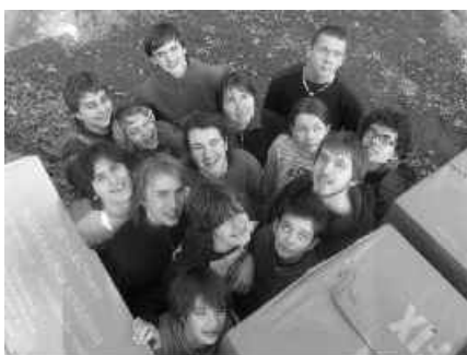
06 mládež z Trenčína