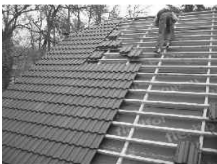
09 strecha sa postupne zakrýva