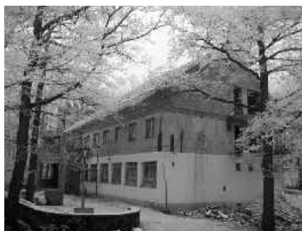
04 zimný spánok - iba zdanlivý