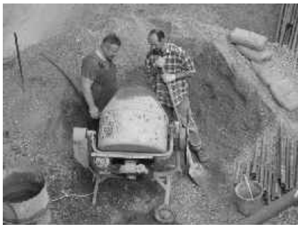
11 betón do pivnice

V apríli sme vďačne prijali pomoc bratov z „dolnej zeme“. Odviedli kus práce pri betónovaní v priestoroch suterénu a izolácii stropu na 2. poschodí. Na ich dielo nadviazali ďalší domáci brigádnicí.