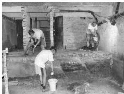
14 skala sa neochotne poddáva