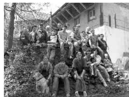
10 brigádnici z blízka i ďaleka