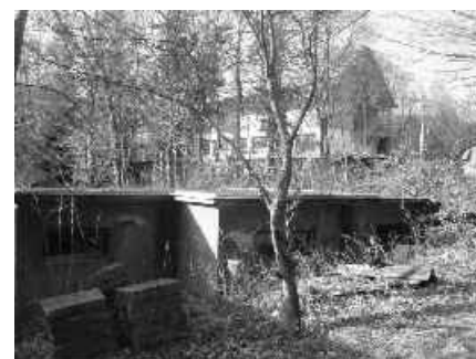
08 kupujeme susedný pozemok