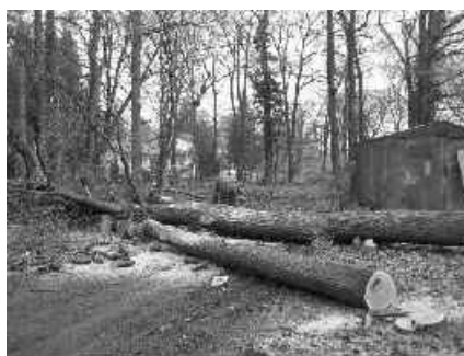
07 stromy padli za obeť