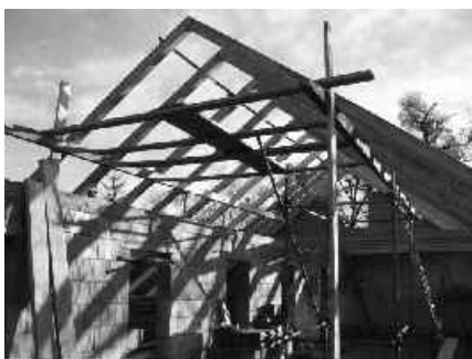
01 postupne vzniká krov