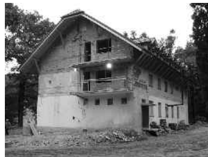
18 súčasná podoba chaty

Aj keď bolo ťažké vopred si predstaviť ubytovanie a stravovanie takého množstva ľudí, podarilo sa a znova sa ukázal potenciál chaty pre takéto stretnutia.