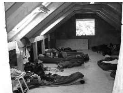
17 provízorne ubytovanie

V auguste bola brigáda mládeže zo slovenských zborov. Ubytovali sa v novovytvorených priestoroch v podkroví a k dispozícii mali aj také vymoženosti, ako splachovacie WC a dokonca teplú sprchu na dvore! Ale v skutočnosti žiaden luxus. Tešíme sa z ich radosti zo vzťahu s Bohom, spoločenstva i práce. V suteréne upravovali budúce klubové priestory, v podkroví montovali podlahy a tepelné izolácie stropu. Samozrejme, užili si aj biblické štúdium listu Kološanom, chvály a voľný čas.