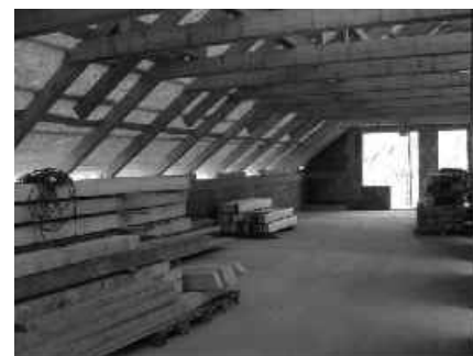
05 nové priestory na 2. poschodí