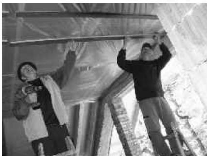
13 izolácia stropu